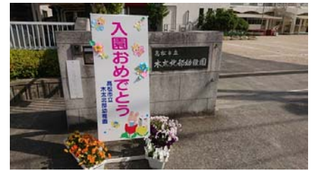
4 / 12 木太北部幼稚園 平成 30 年度 入園式