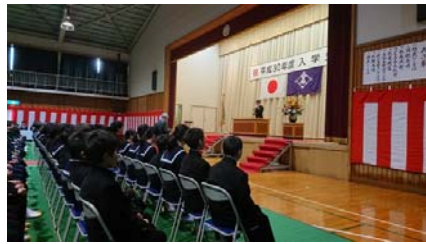
4 / 10 玉藻中学校 平成 30 年度 入学式