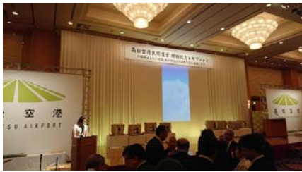
4 / 1 高松空港 民間運営記念レセプション