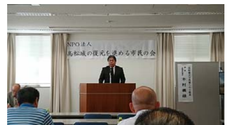
5 / 19 高松城の復元を進める市民の会 通常総会