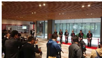
4 / 24 高松市防災総合庁舎 (危機管理センター) 落成式