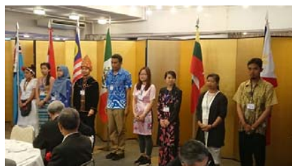
5 / 23 オイスカ高松推進協議会 第 8 回 総会