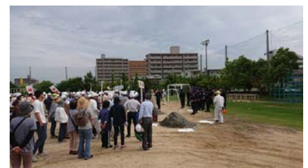
6 / 10 木太地区 防災訓練