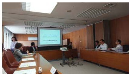
5 / 11 高松市観光振興議員連盟 総会・勉強会