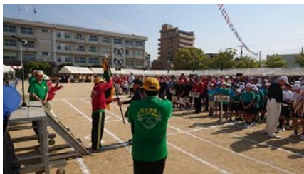
4 / 22 木太地区 第 44 回 町民大運動会