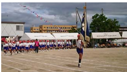
5 / 19 木太北部小学校 春季大運動会