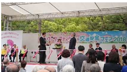
5 / 3 高松市春のまつり「フラワーフェスティバル &交通安全フェア 2018」