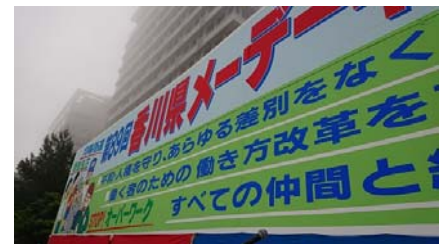
5 / 1 連合香川 第 89 回香川県メーデー中央集会