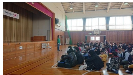
12/23 木太町 木太北部子ども会冬の祭り