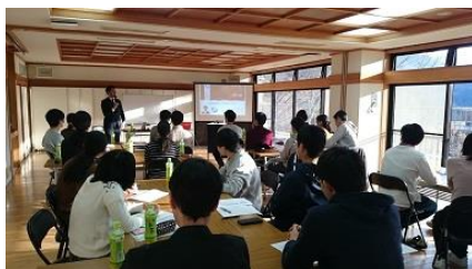
12/15 四国電労 市政報告（青年部セミナー）