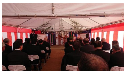
1/17 高松市 新設第二学校給食センター （仮称）安全祈願祭・起工式