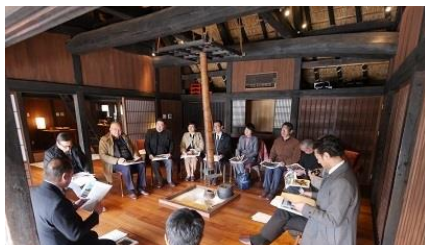
1/10 高松市観光振興議員連盟 先進地視察（徳島県三好市）