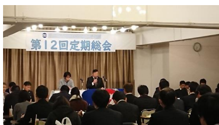
2/1 連合香川東地域協議会 第12回定期総会