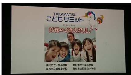
2/17 高松市・高松栗林ライオンズクラブ TAKAMATSU こどもサミット