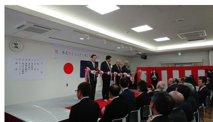
3/16 木太町 木太コミュニティセンター落成式