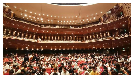
1/13 高松市 第14回 地域医療セミナー