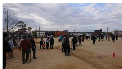
1/27 木太町 第18回グランドゴルフ大会