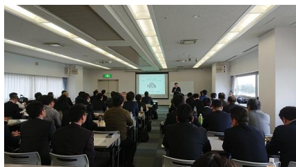
12/8 四国地方労働組合生産性会議 第61回研究フォーラム