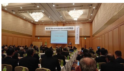
1/18 香川県市議会議長会 第21回議員研修会